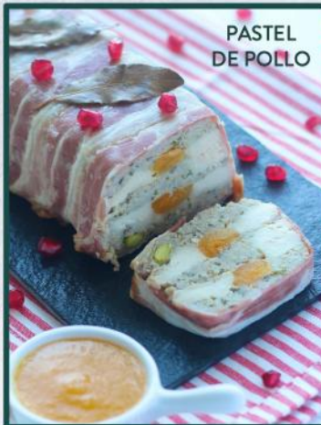
PASTEL DE POLLO