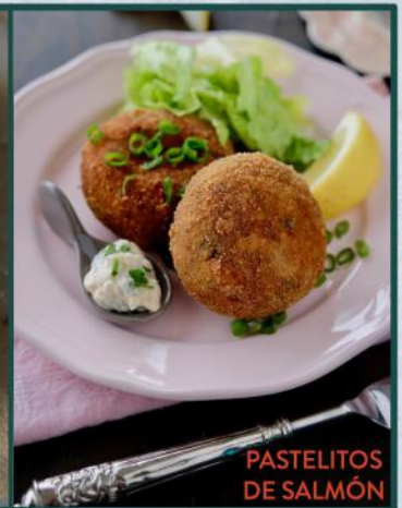
PASTELITOS DE SALMÓN